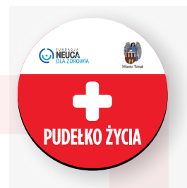
Magnes informacyjny na lodówkę